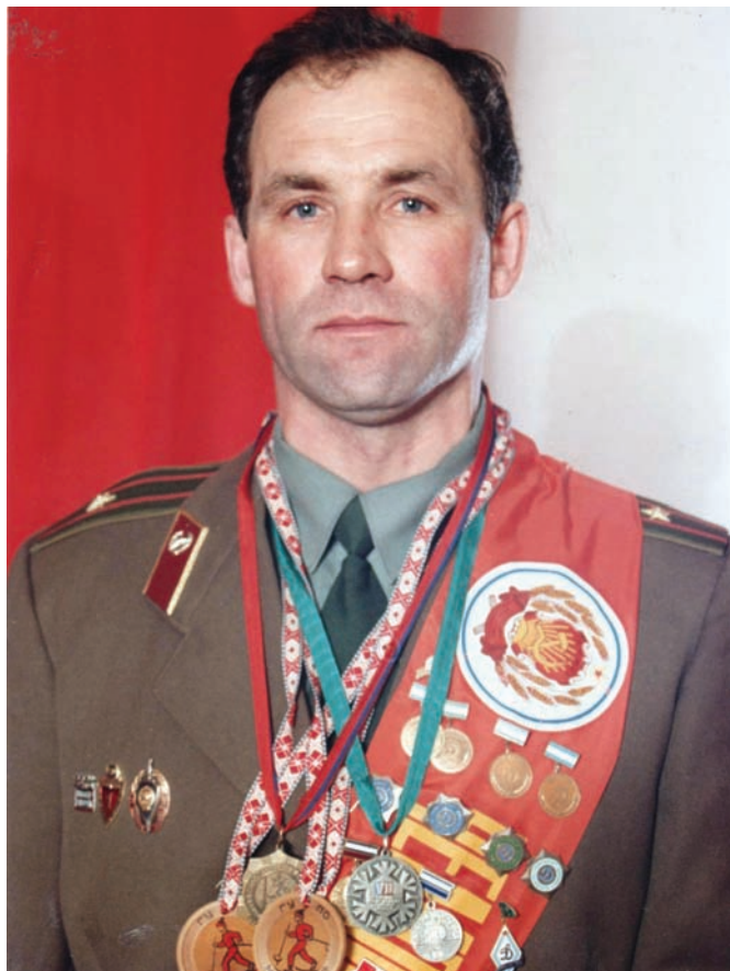
Валерий Буйлин, МС СССР, перейдя из лыжных гонок в биатлон достиг высоких спортивных результатов: 4-х кратный Чемпион ЦС «Динамо», 5 место на Чемпионате СССР -1972 г. Стал победителем и призером многих всероссийских и международных соревнований.