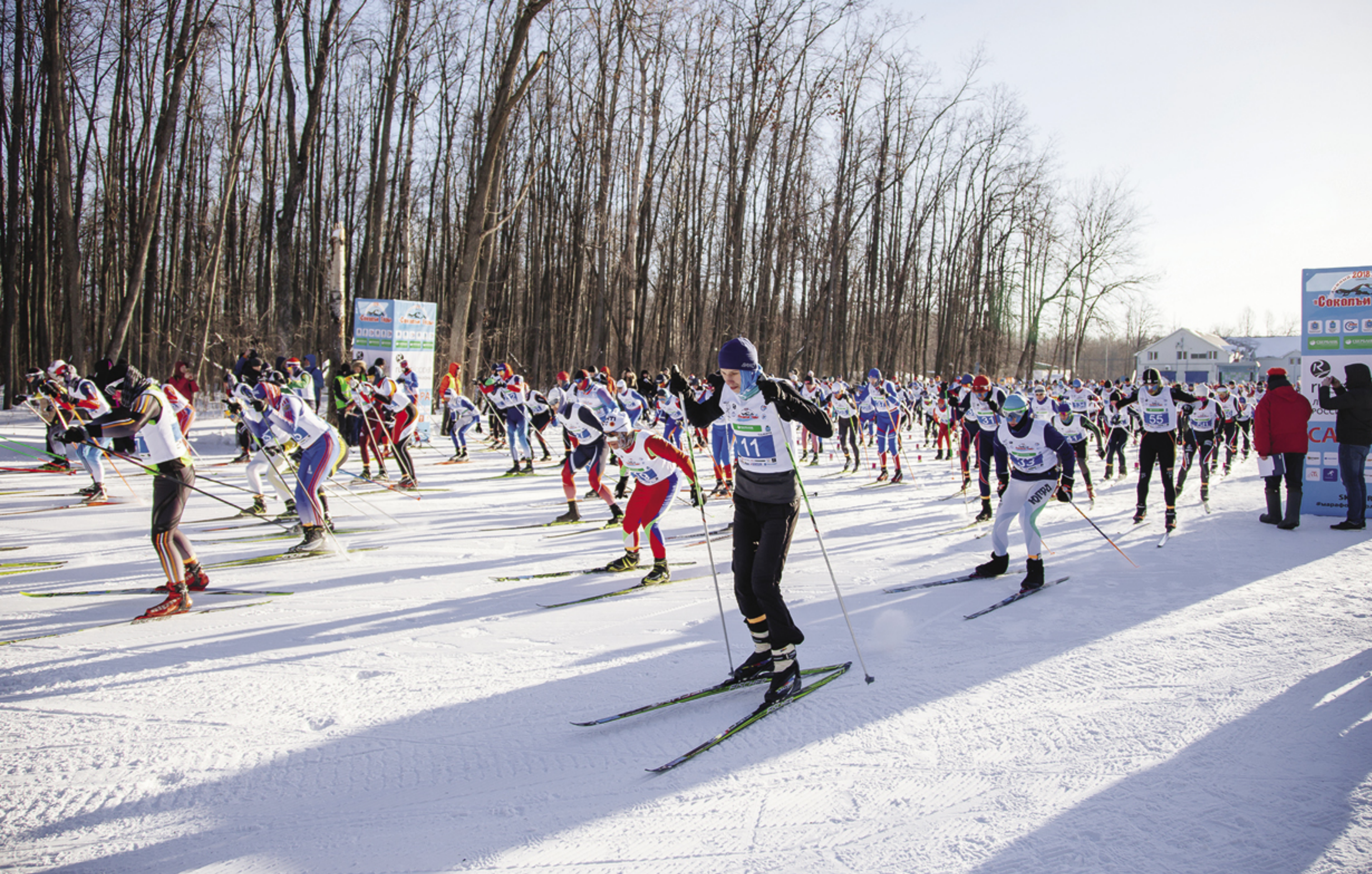
Старт лыжного марафона «Соколы Горы 2018»