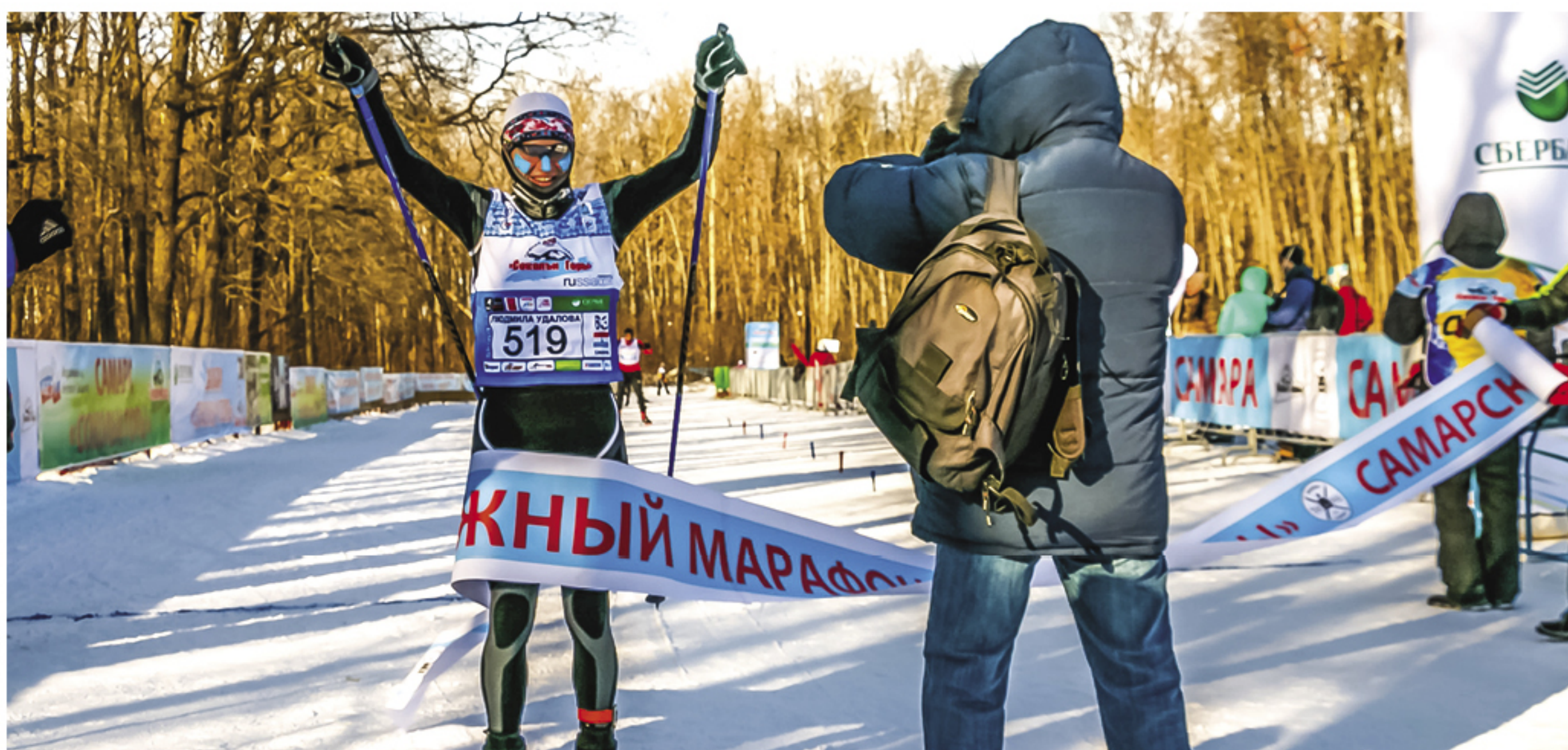
Победитель на 30 км в абсолюте среди женщин лыжного марафона «Соколы Горы 2018»