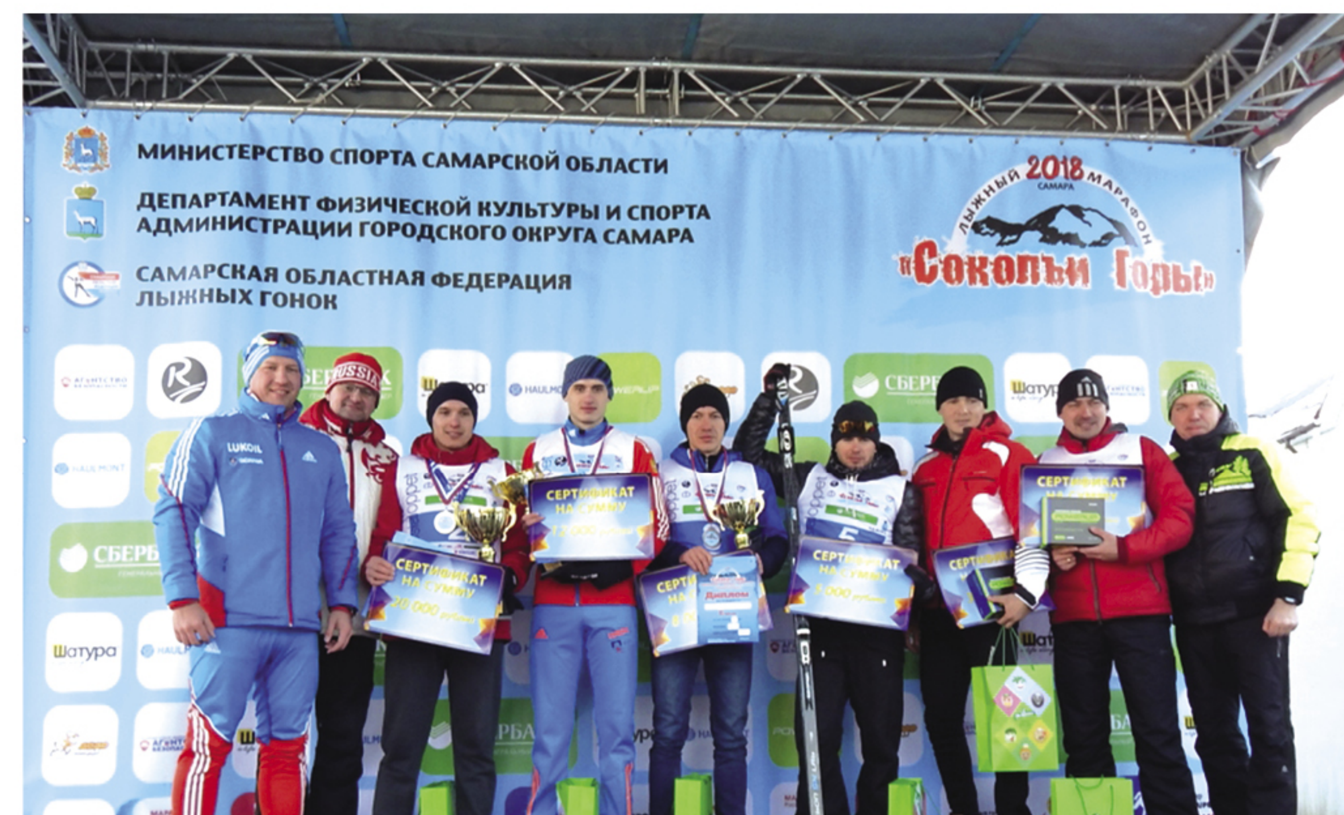
Награждение абсолютных победителей лыжного марафона «Соколы Горы 2018» на дистанции 50 км среди мужчин с 1 по 6 место