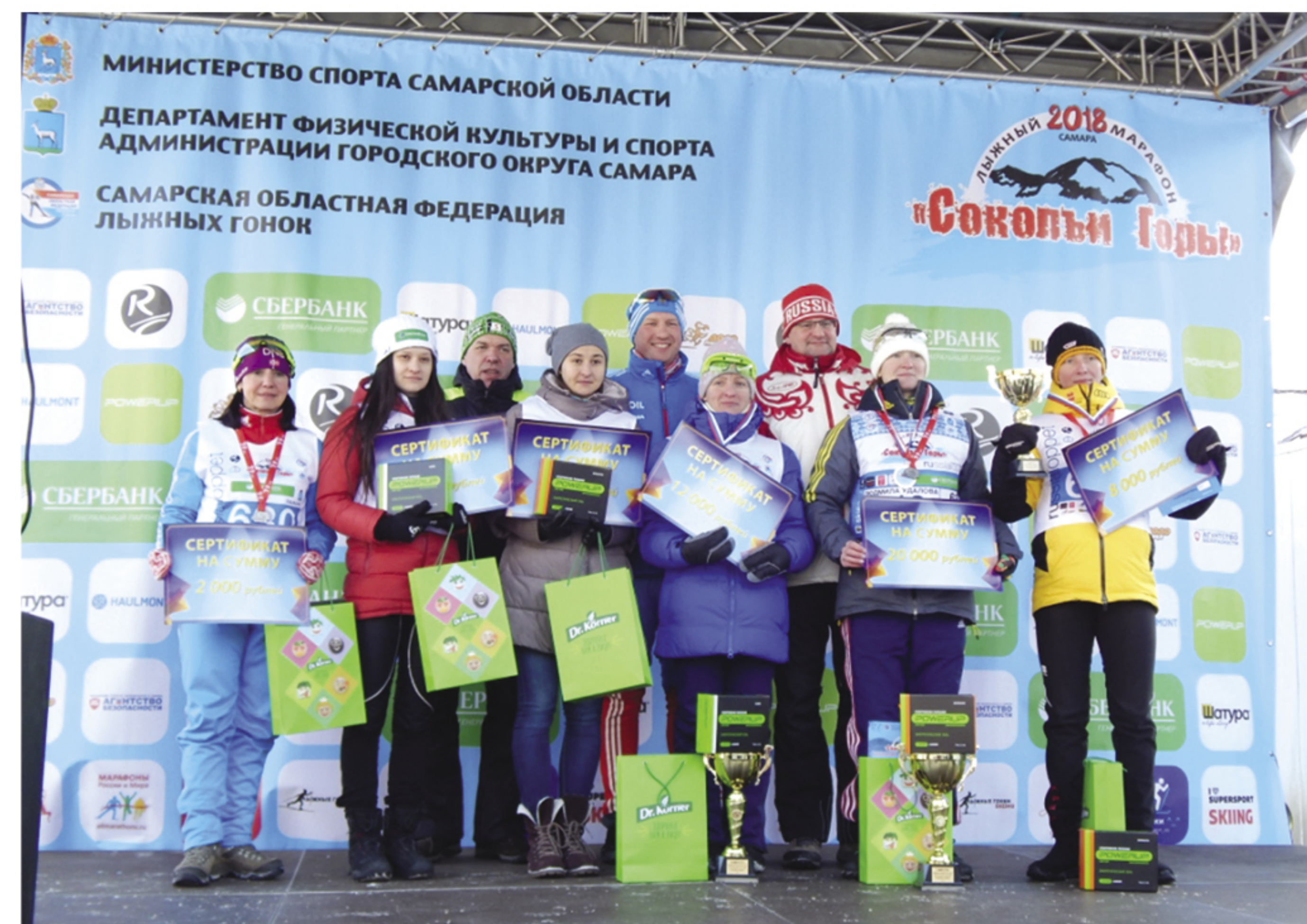
Награждение абсолютных победительниц лыжного марафона «Соколы Горы 2018» на дистанции 30 км среди женщин с 1 по 6 место

16:00 Закрытие финиша лыжного марафона «Соколы Горы»