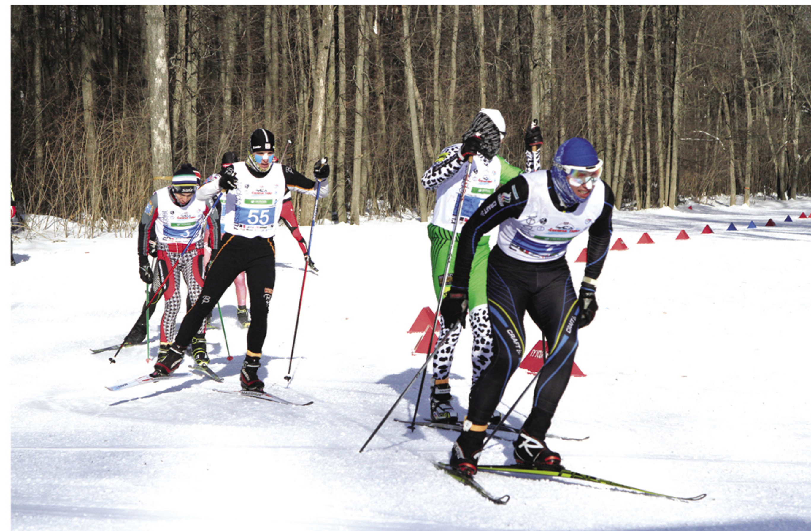
Лидер лыжного марафона «Соколы Горы 2018»