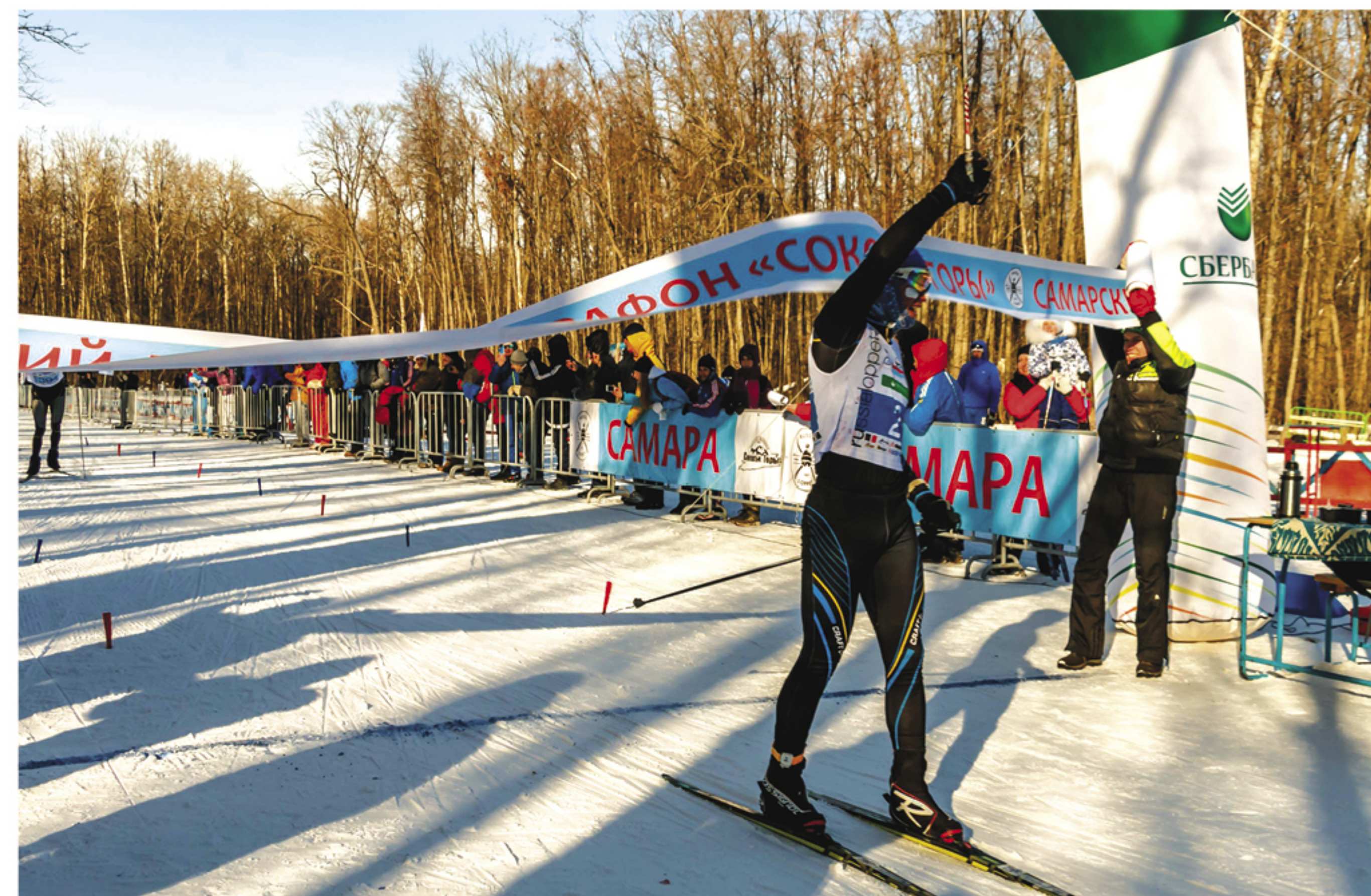
Золотой финиш лыжного марафона «Соколы Горы 2018»