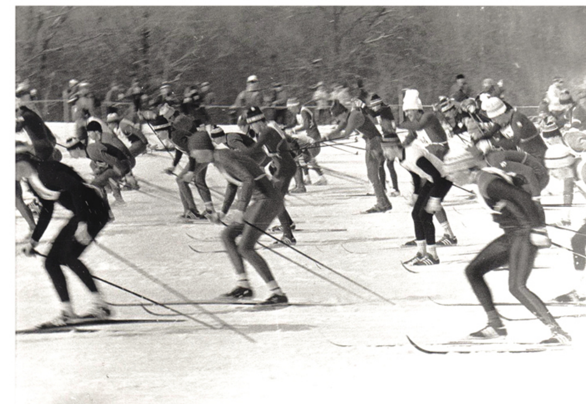
Дан старт участникам Куйбышевского лыжного марафона

Марафонские гонки, как правило, проходили в нашем регионе на лыжной базе «Динамо», потом перекочевали на «Чайку», а в 1988 году из-за огромного интереса к гонке и наплыва участников местом проведения стала набережная Волги под Полевым спуском.