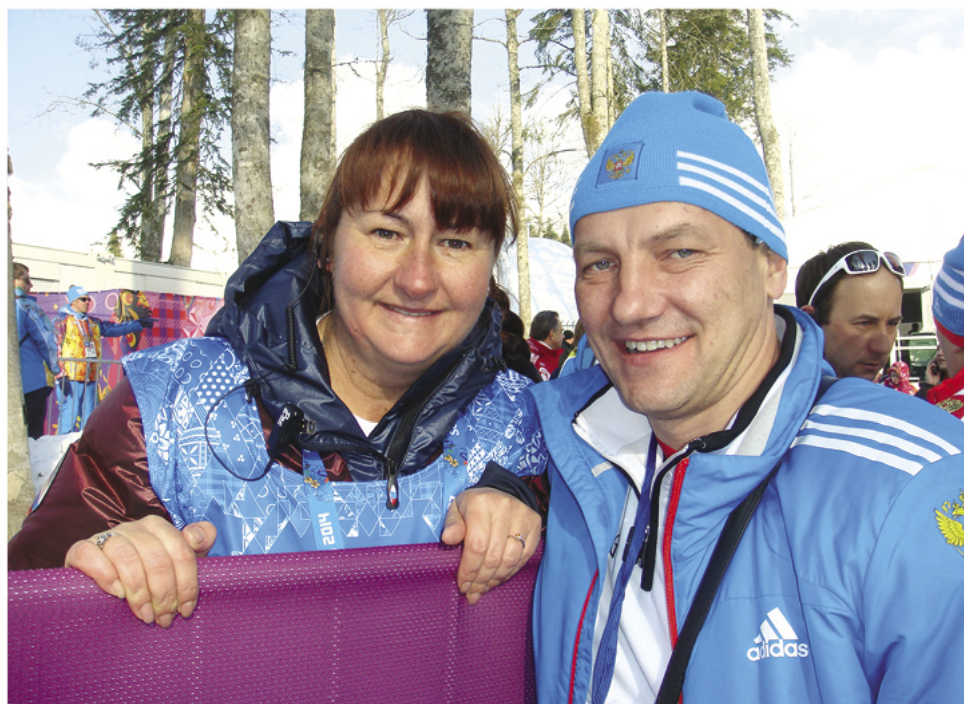
С президентом Федерации лыжных гонок России Еленой Вяльбе

Природа не дала ему столько таланта, как родителям, которые блистали на всесоюзной арене. Но он выделялся колоссальным терпением и работоспособностью. Не помню, чтобы он пропу-