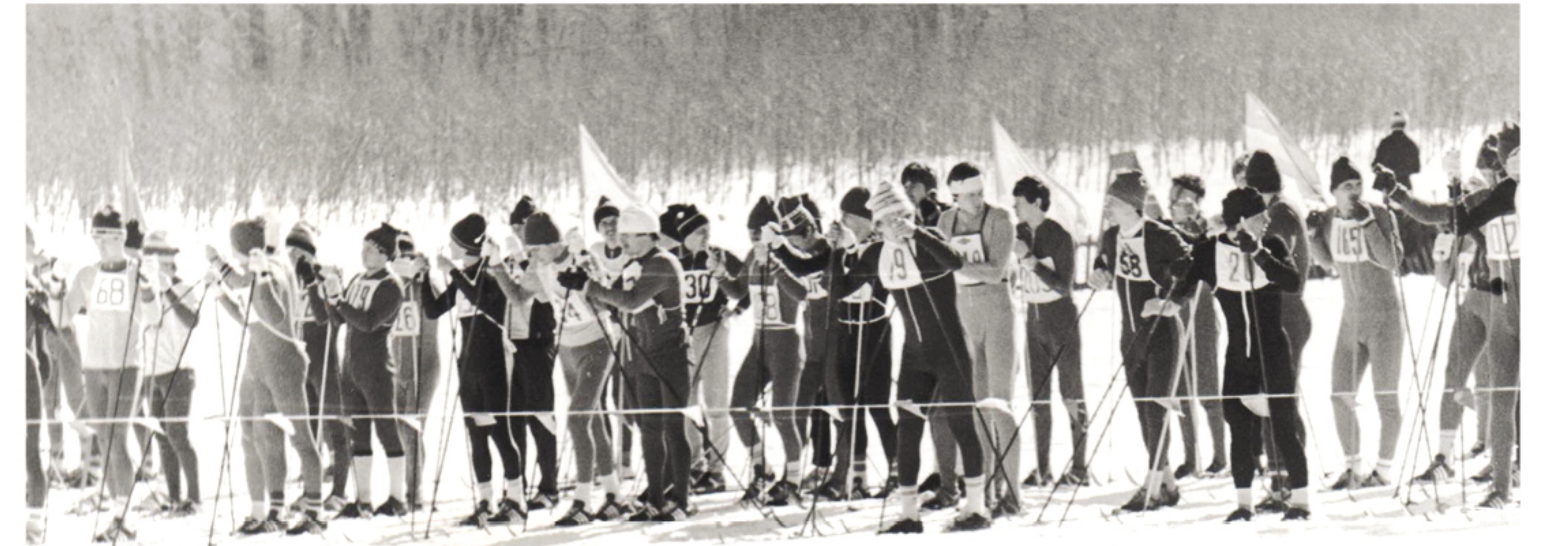
Подготовка к старту Куйбышевского лыжного марафона 1989 года

Вспоминая историю лыжного спорта Самары, невольно обращаешь внимание на одну деталь. Раньше лыжные марафоны на 50 км у мужчин и 30 километров у женщин были привычным номером программы областной зимней спар-