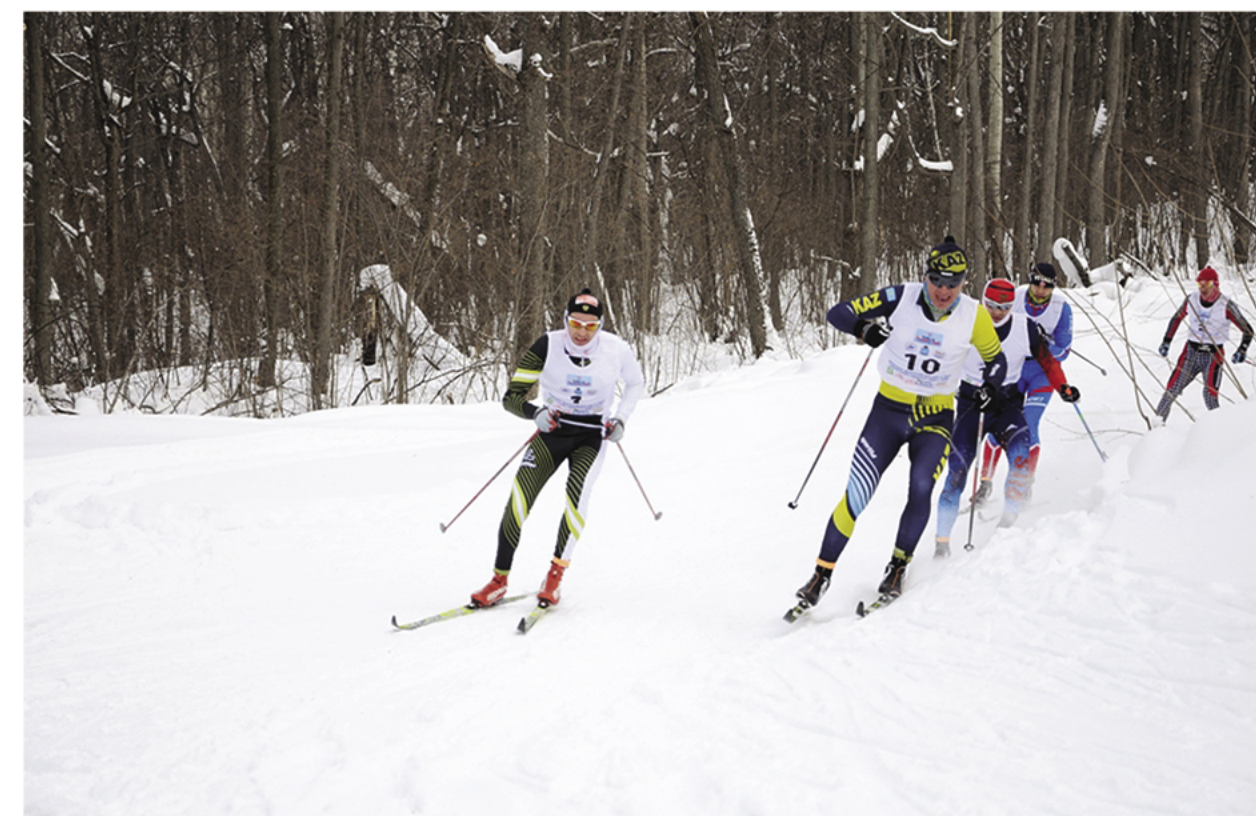
Лидеры лыжного марафона «Соколы Горы 2015» на опасном повороте

Лыжная трасса для марафона имеет достаточно привлекательный, разнообразный рельеф с набором высоты на 50 км – 475 м. Спуски прямые и открытые. Участникам стоит быть особо внимательными в районе 14 км дистанции, где имеется резкий разворот влево в конце спуска.