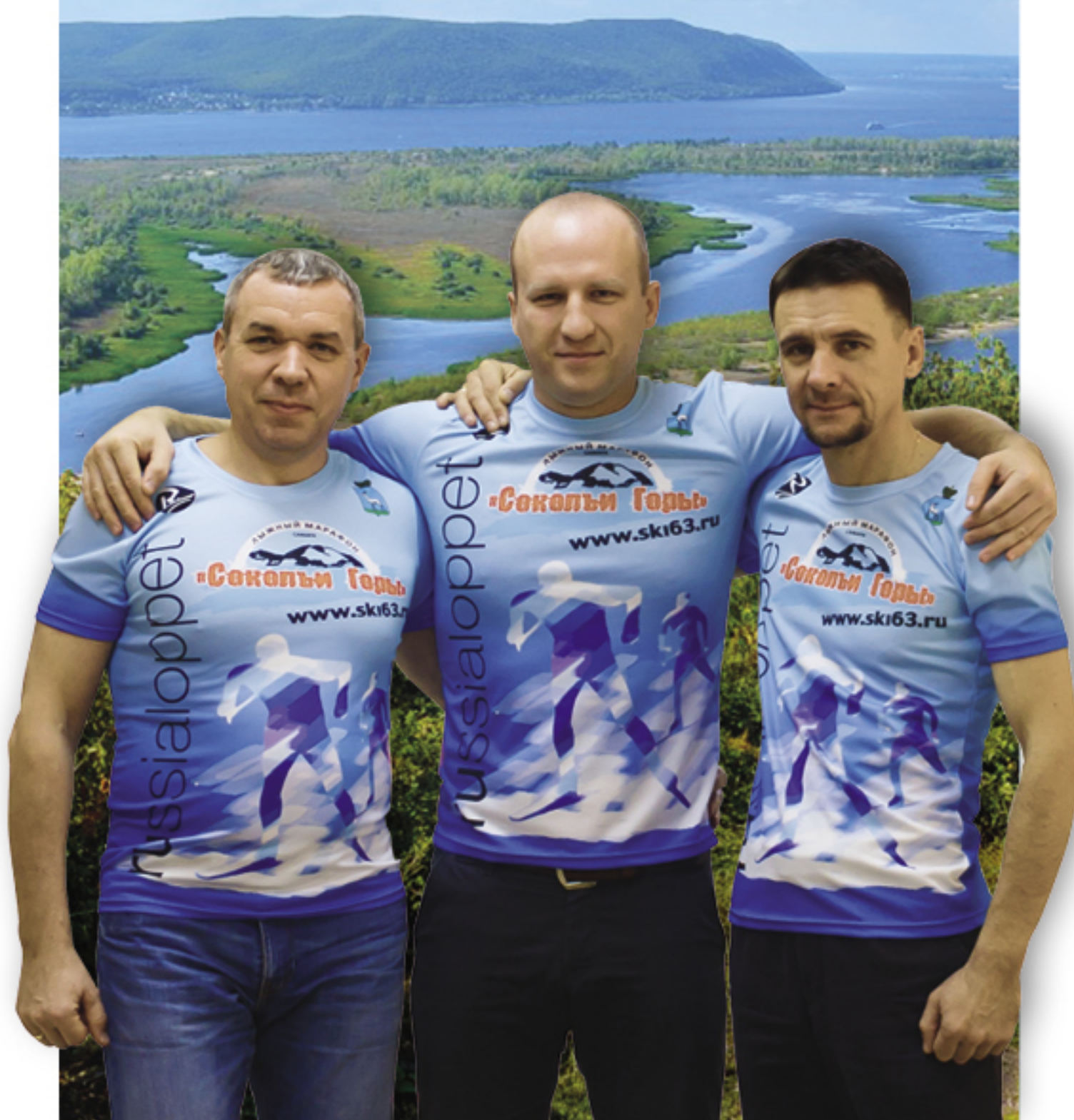
Оргкомитет «Соколы Горы 2018»